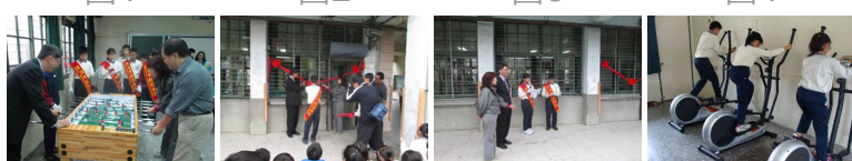
圖5 圖6 圖7 圖8