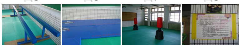
圖9 圖10 圖11 圖12