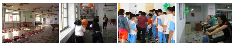
圖1 圖2 圖3 圖4