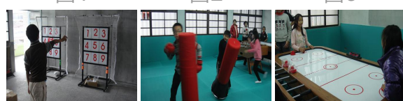
圖5 圖6 圖7