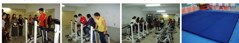
圖9 圖10 圖11 圖12