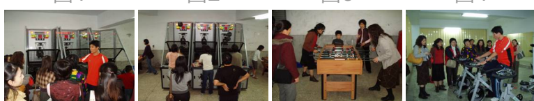
圖5 圖6 圖7 圖8