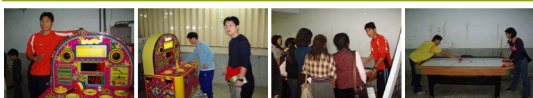
圖1 圖2 圖3 圖4