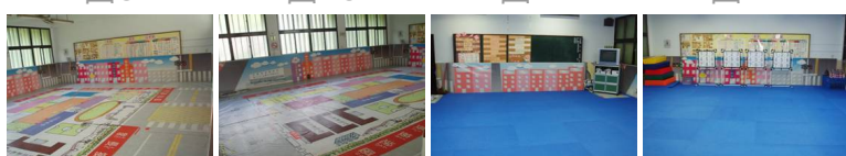
圖13 圖14 圖15 圖16