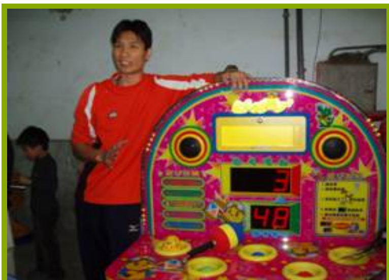
圖1： 1. 打地鼠機使用說明與教師嘗試操作