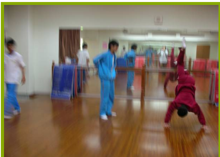
圖1：舞蹈教室使用情況