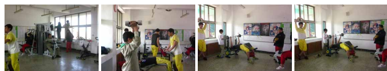
圖2 圖3 圖4