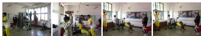
圖2 圖3 圖4