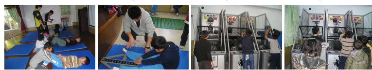
圖5 圖6 圖7 圖8