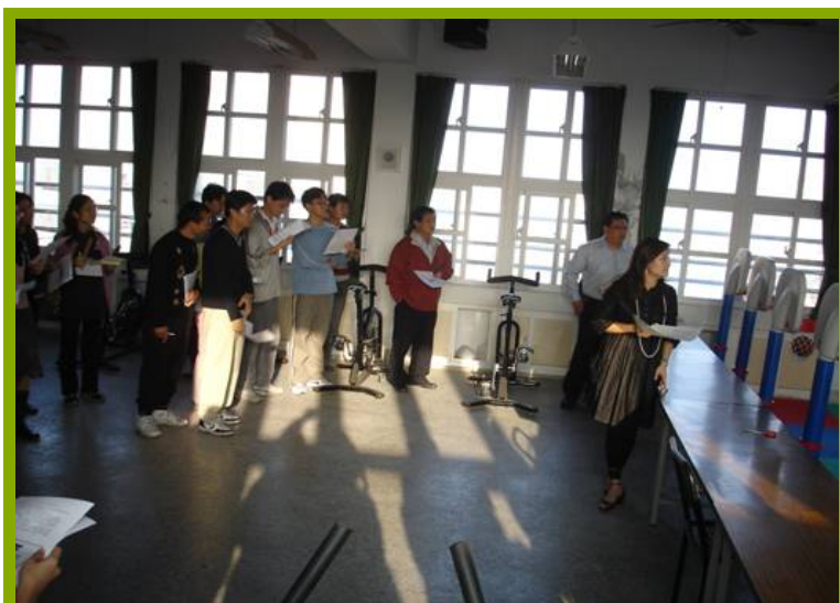
圖1：承辦單位運動站說明使用規則