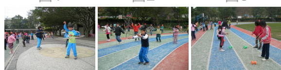
圖5 圖6 圖7