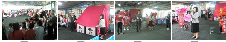
圖17 圖18 圖19 圖20