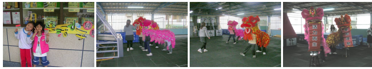
圖13 圖14 圖15 圖16