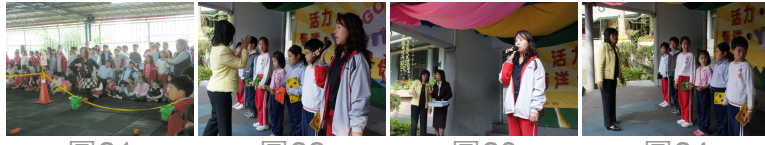
圖21 圖22 圖23 圖24