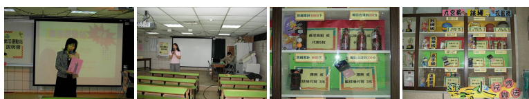
圖1 圖2 圖3 圖4