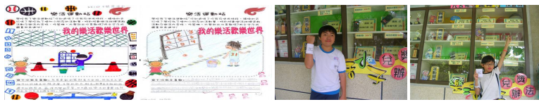
圖9 圖10 圖11 圖12