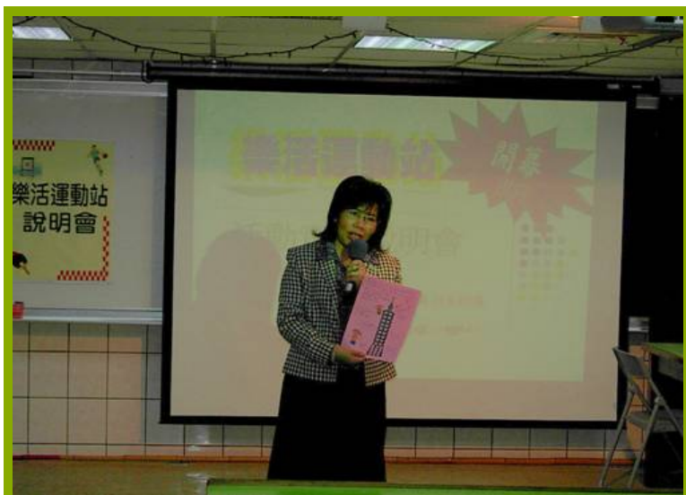
圖1：樂活運動站開幕，校長講話