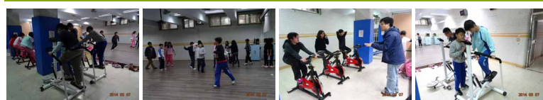
圖2 圖3 圖4