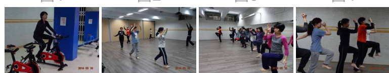
圖5 圖6 圖7 圖8