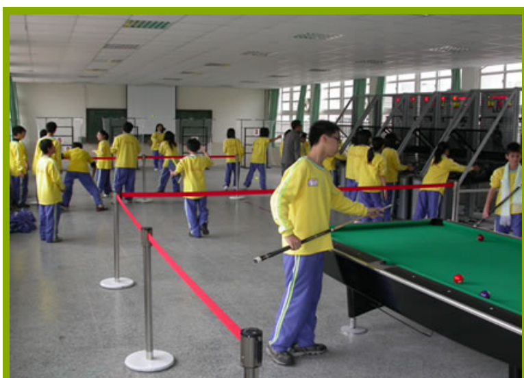
圖1：撞球台使用情形