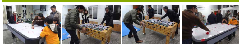
圖2 圖3 圖4