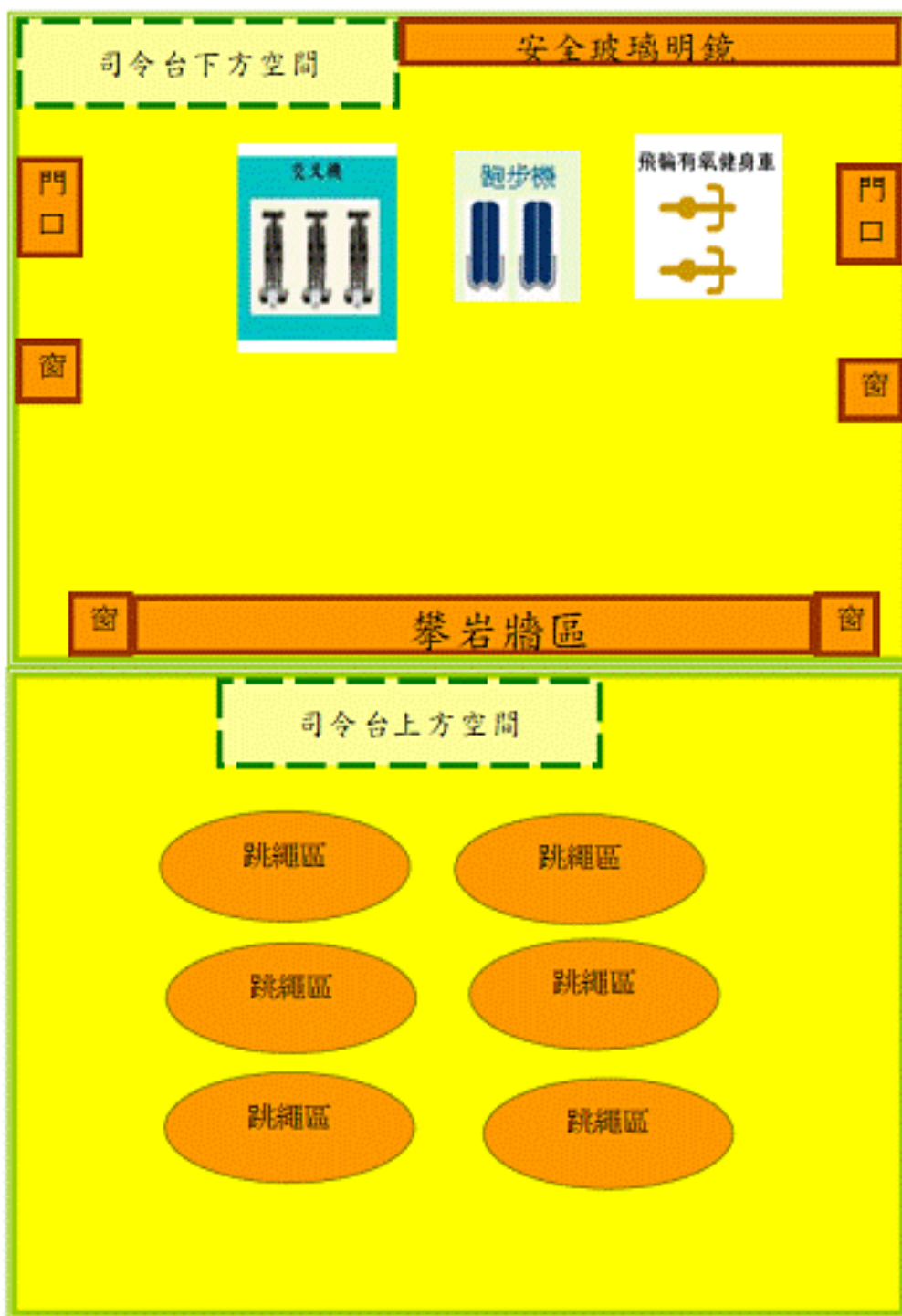
圖二 綜合運動練習區