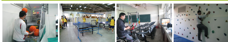
圖1 圖2 圖3 圖4