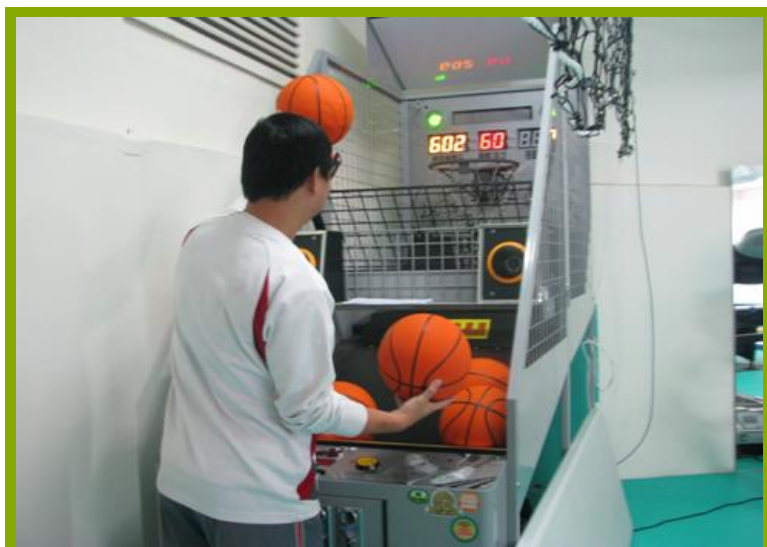
圖1：更衣淋浴間設施