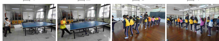
圖5 圖6 圖7 圖8