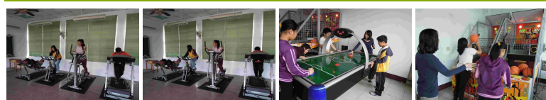
圖1 圖2 圖3 圖4