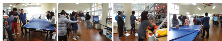
圖8 圖9 圖10 圖11 圖12