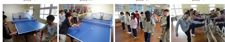
圖5 圖6 圖7