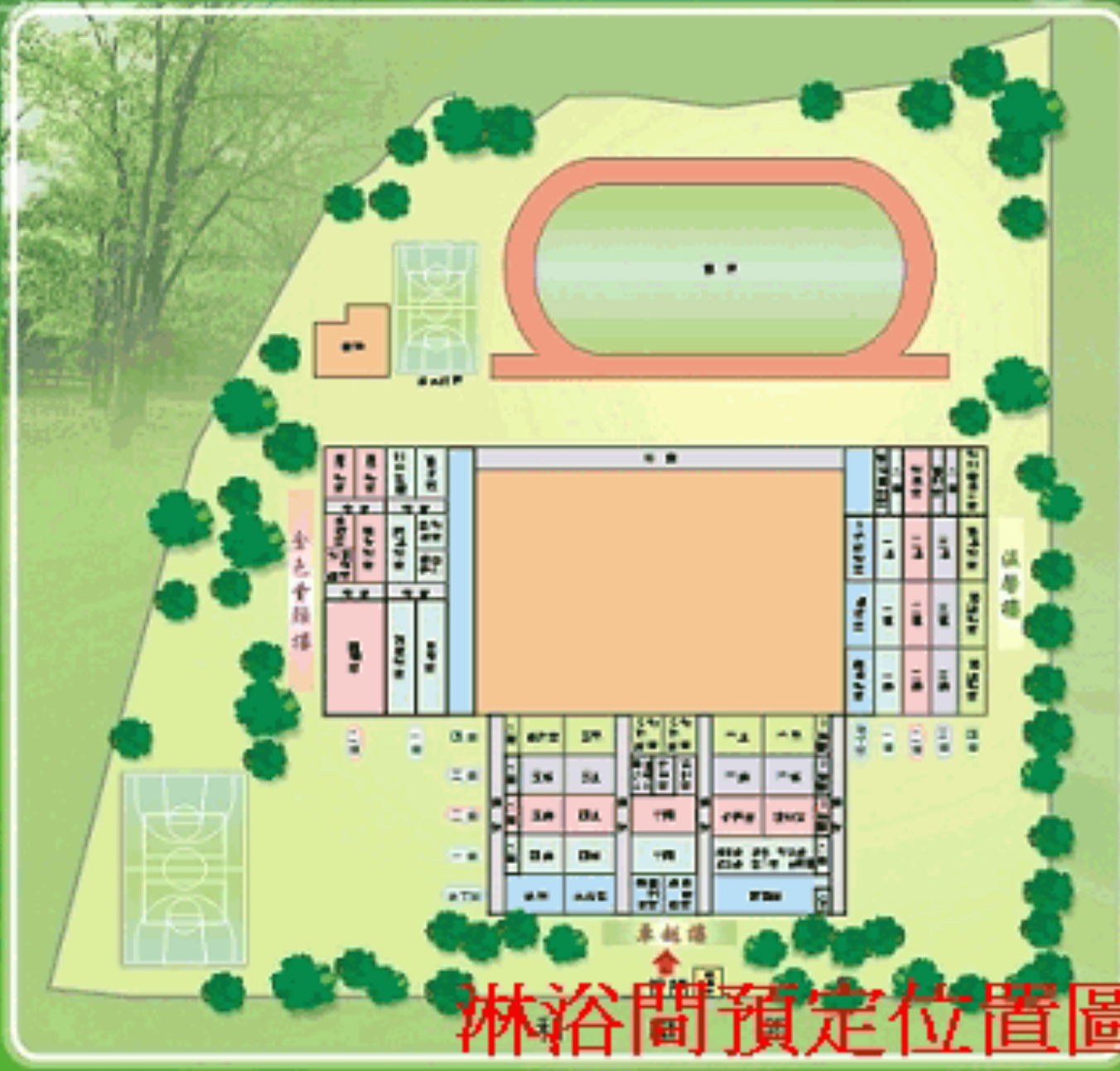
淋浴間預定位置圖(箭頭處)