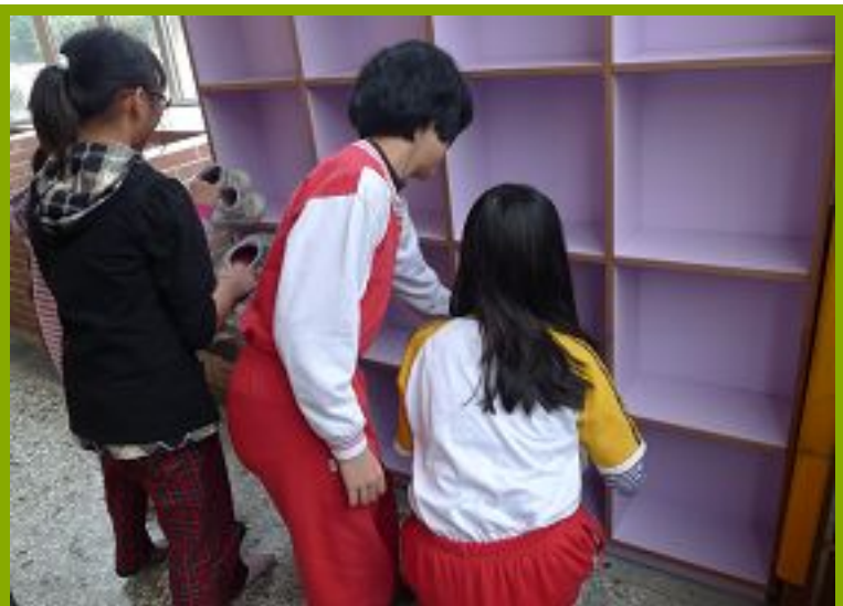
圖1：更衣淋浴間設施