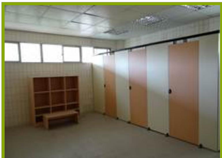
圖1：更衣淋浴間設施