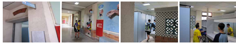
圖21 圖22 圖23 圖24