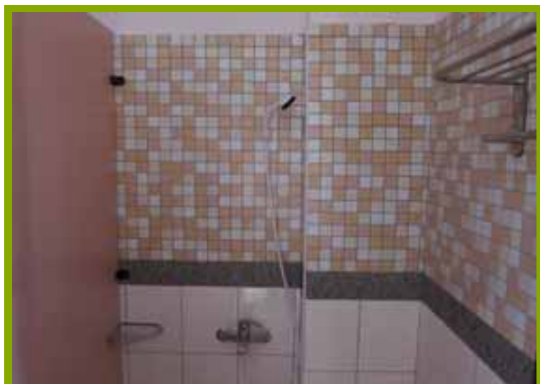
圖1：更衣淋浴間設施