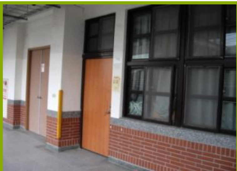
圖1：更衣淋浴間設施