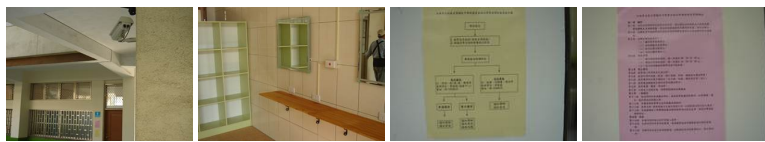
圖4 圖5 圖6 圖7 圖8