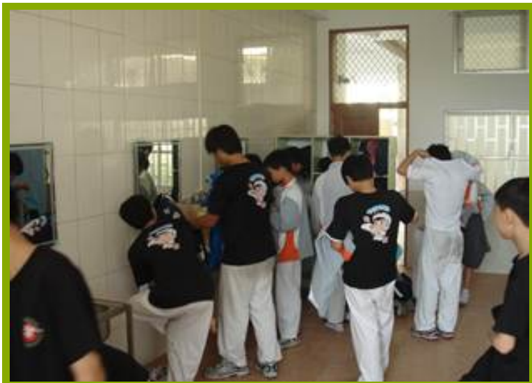
圖1：更衣淋浴間設施