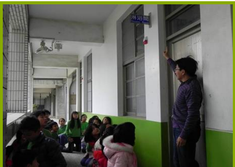
圖1：更衣淋浴間設施