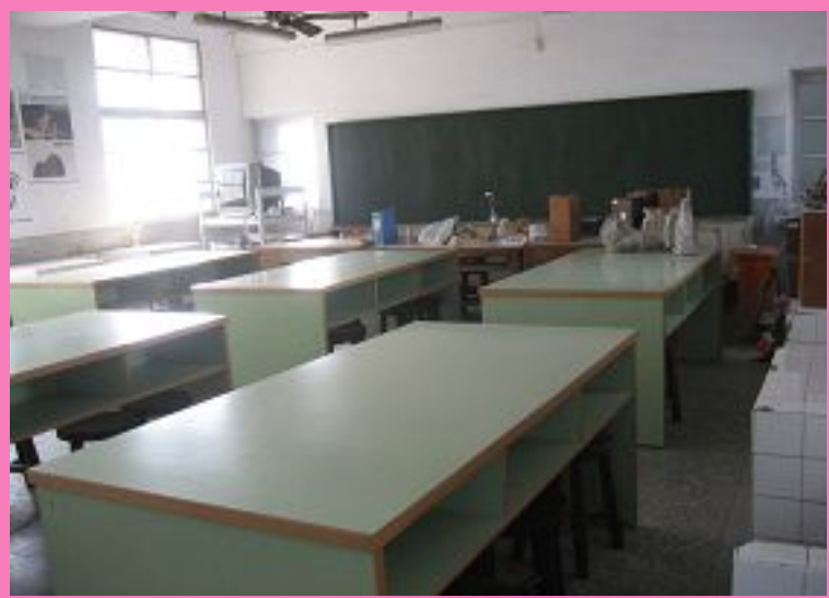
圖1：學生體驗更衣淋浴間設施