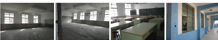
圖13 圖14 圖15 圖16