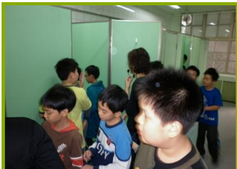
圖1：學生體驗淋浴間設施