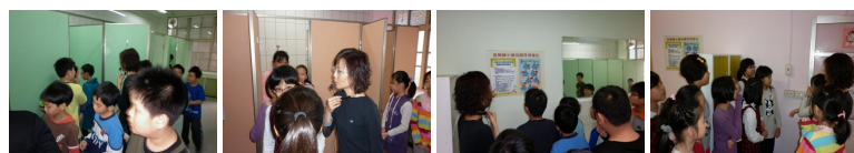
圖1 圖2 圖3 圖4