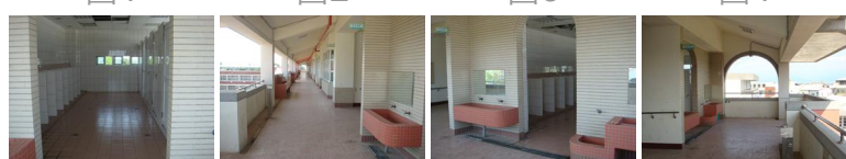
圖5 圖6 圖7 圖8