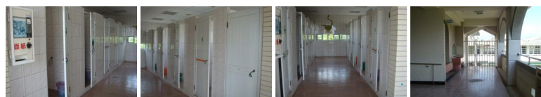
圖1 圖2 圖3 圖4