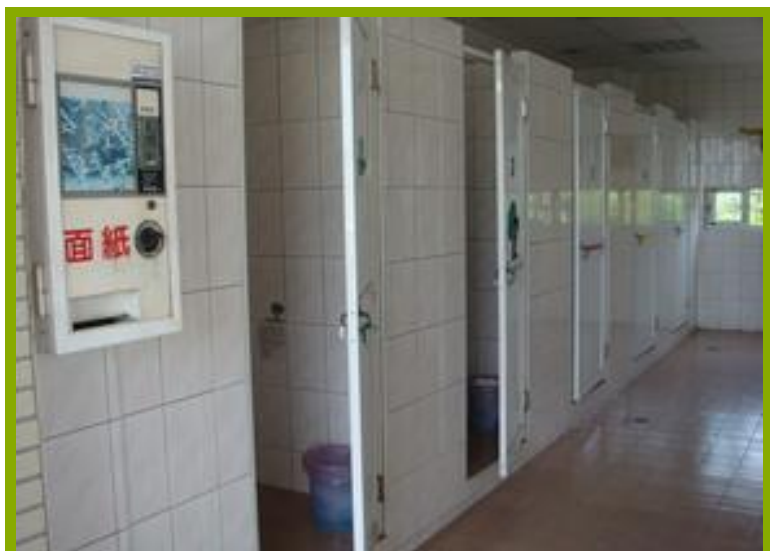
圖1：更衣淋浴間設施