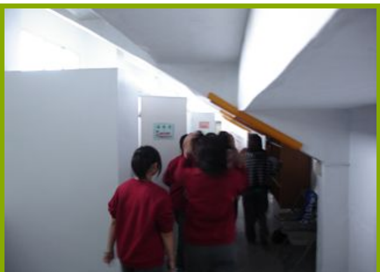
圖1：學生體驗淋浴間設施