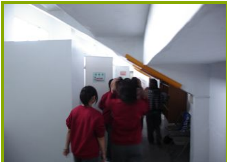
圖1：學生體驗淋浴間設施