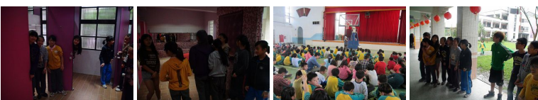
圖21 圖22 圖23 圖24