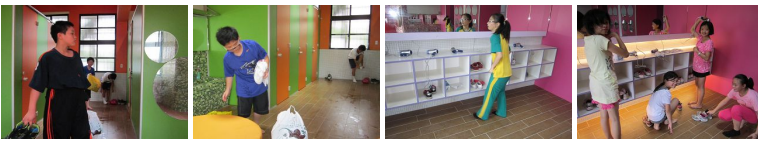
圖2 圖3 圖4