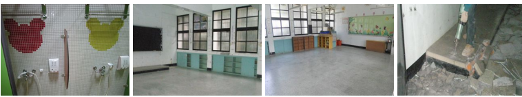
圖13 圖14 圖15 圖16