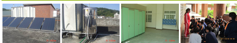
圖2 圖3 圖4