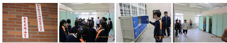
圖13 圖14 圖15 圖16