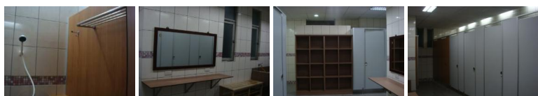
圖1 圖2 圖3 圖4