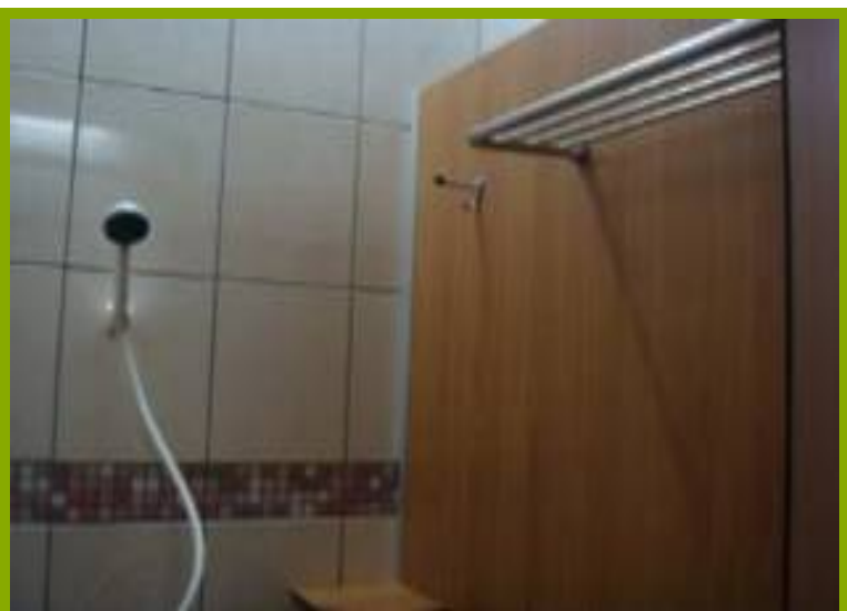
圖1：學生體驗樂活設施