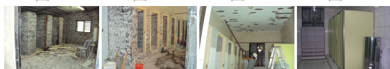
圖21 圖22 圖23 圖24