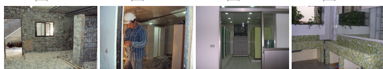
圖17 圖18 圖19 圖20