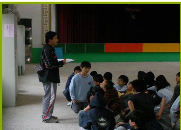
圖1：學生體驗樂活設施