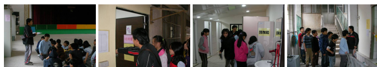
圖1 圖2 圖3 圖4