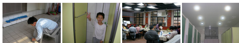
圖9 圖10 圖11 圖12