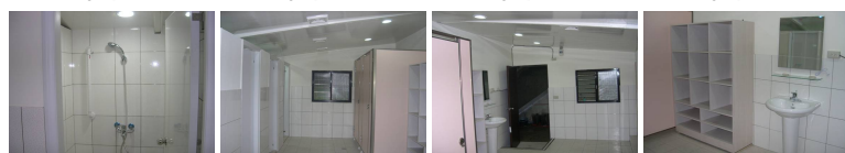
圖13 圖14 圖15 圖16