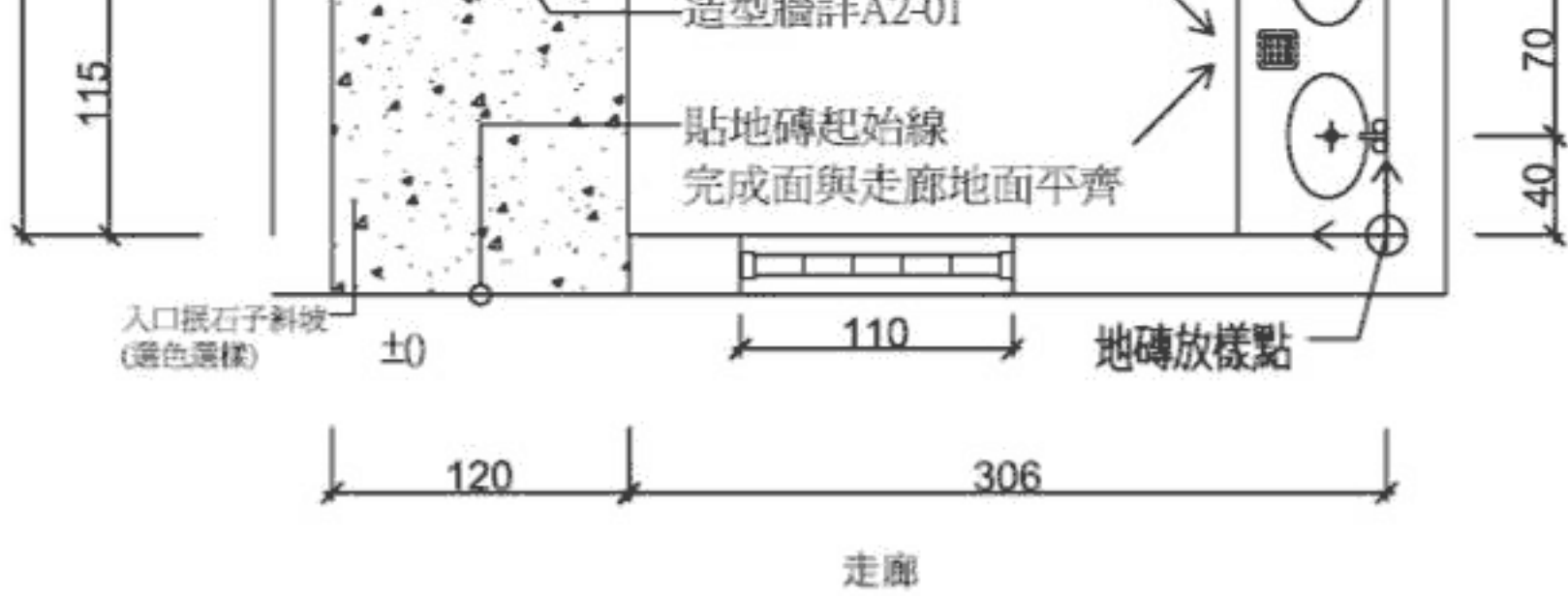
① 二樓女淋浴間整修平面圖