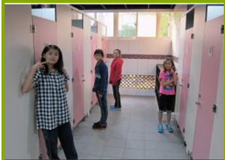
圖1：更衣淋浴間設施