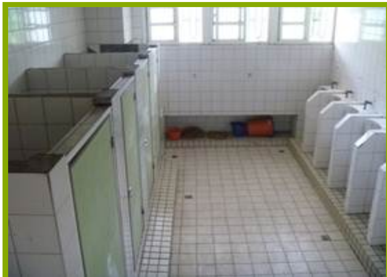
圖1：更衣淋浴間設施