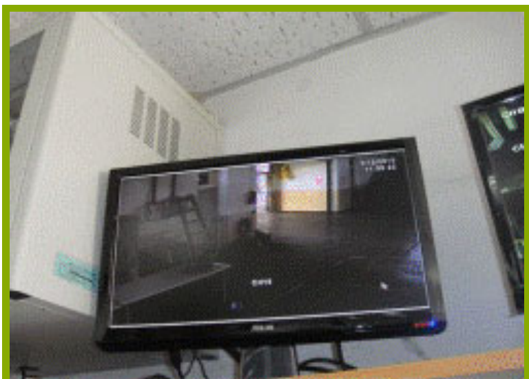
圖1：更衣淋浴間設施