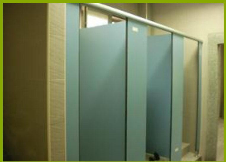
圖1：更衣淋浴間設施