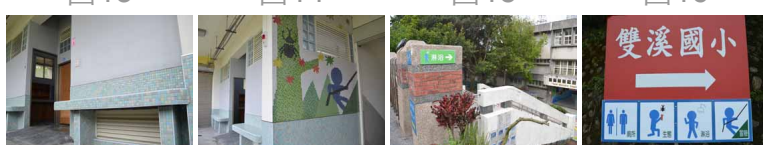
圖17 圖18 圖19 圖20