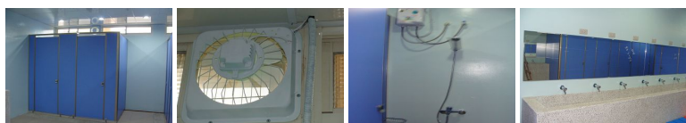
圖9 圖10 圖11 圖12