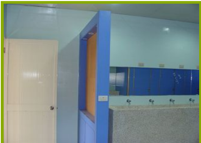
圖1：學生體驗淋浴間設施