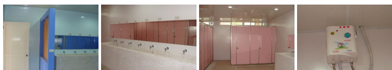
圖2 圖3 圖4