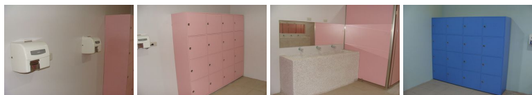
圖5 圖6 圖7 圖8