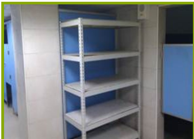
圖1：更衣淋浴間設施