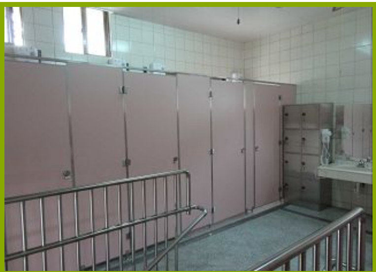
圖1：學生體驗樂活設施