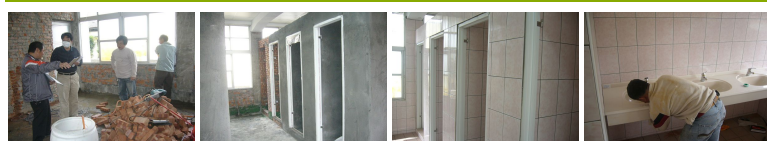
圖1 圖2 圖3 圖4