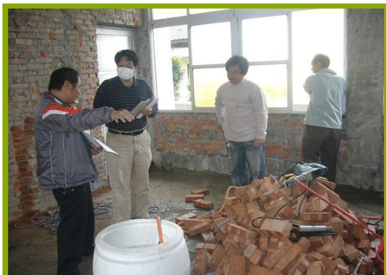
圖1：更衣淋浴間設施