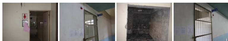
圖2 圖3 圖4