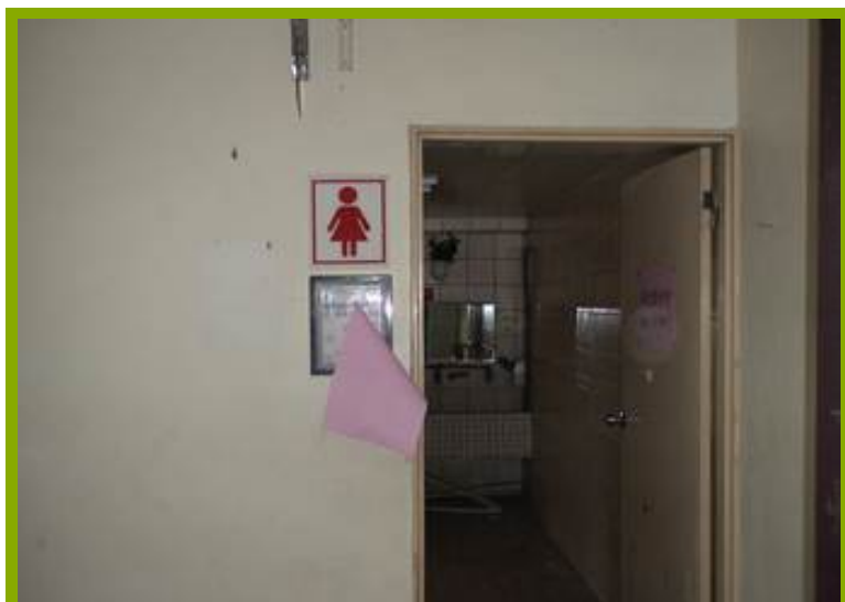
圖1：更衣淋浴間設施