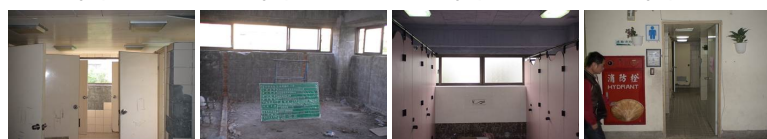
圖13 圖14 圖15 圖16