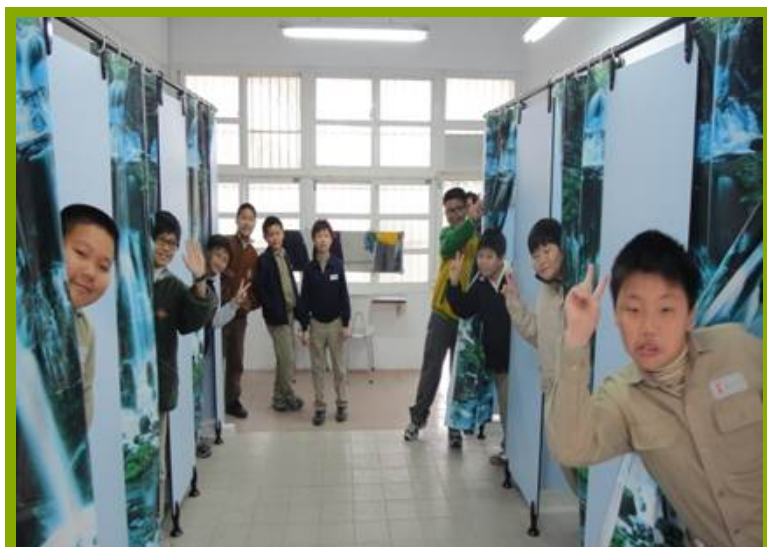
圖1：更衣淋浴間設施