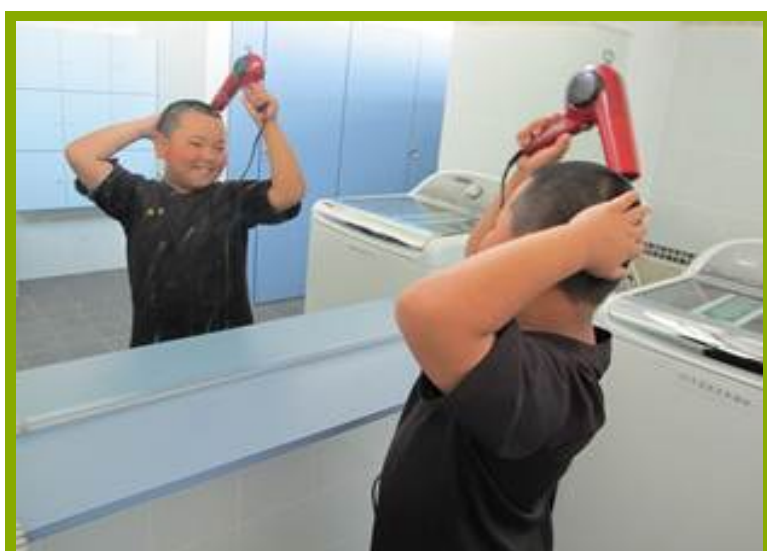
圖1：更衣淋浴間設施