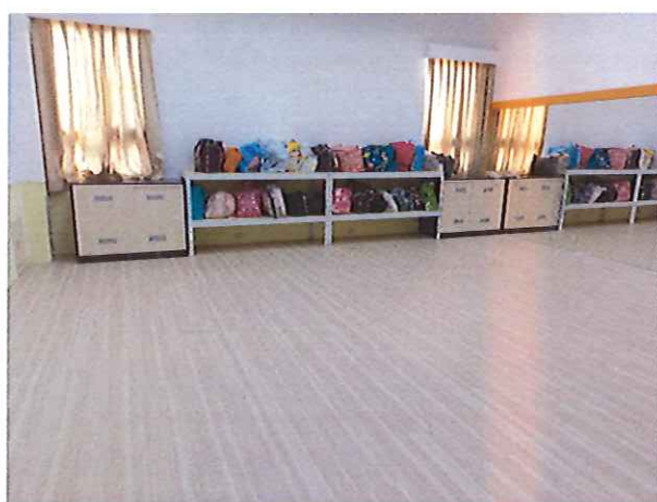
照片說明：舞蹈教室