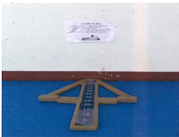
照片說明：坐姿體前彎測量器